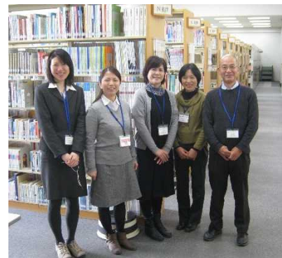
お気軽にご利用ください