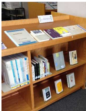
「学生に読んでほしい本」コーナー

本学の基本理念のひとつに「県民の健康・医療・福祉環境の更なる向上に寄与する」ことが掲げられています。医療従事者はもちろんのこと、地域住民の方にも、ご自身の健康等を考える上での専門情報源として、本館をご活用いただければと思います。より身近な存在に感じていただけるよう、これからも所蔵や環境整備に努めていきたいと考えています。